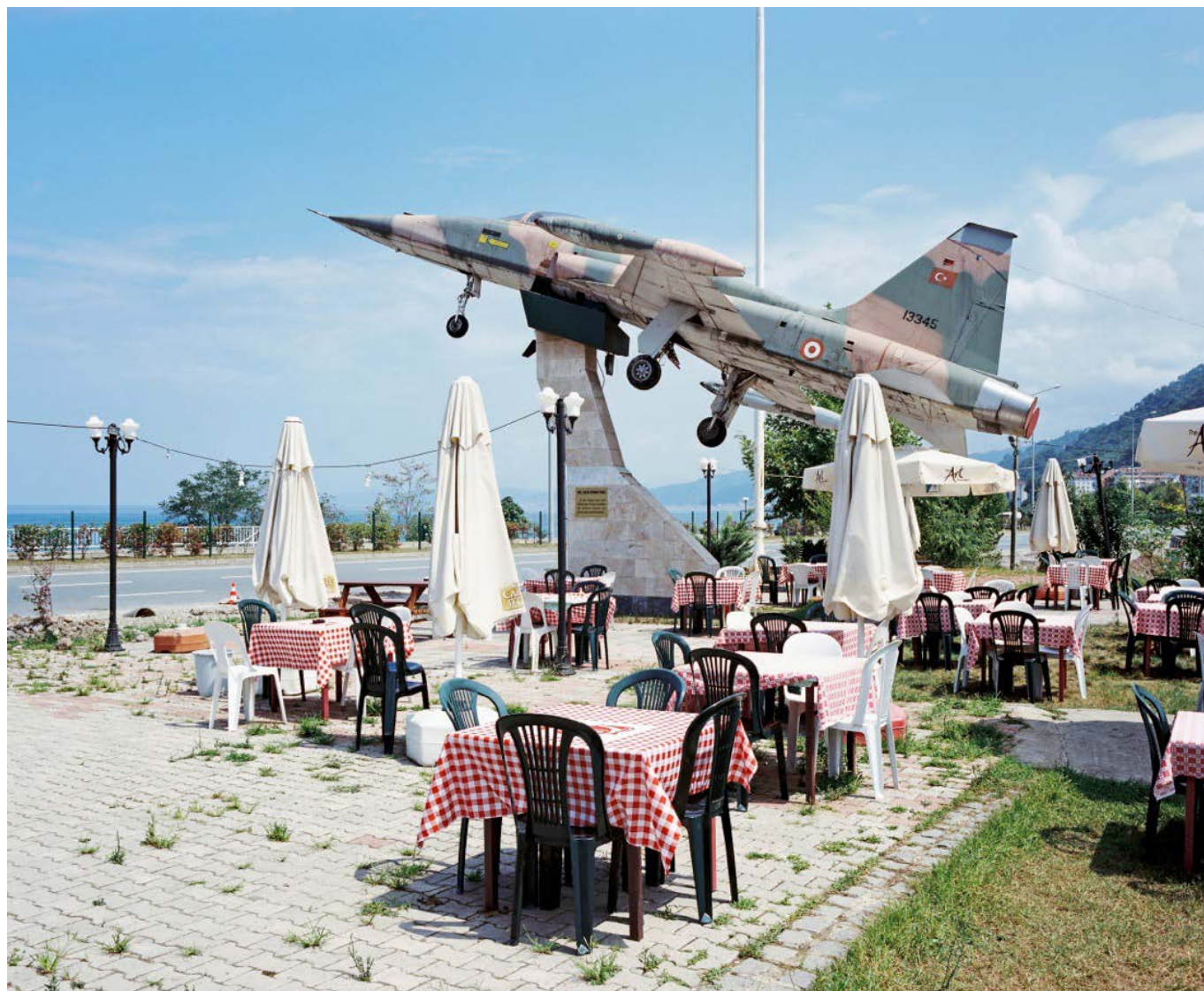
La terrasse d'un restaurant sur la côte de la mer Noire, à côté de la ville de Gerze, en Turquie.