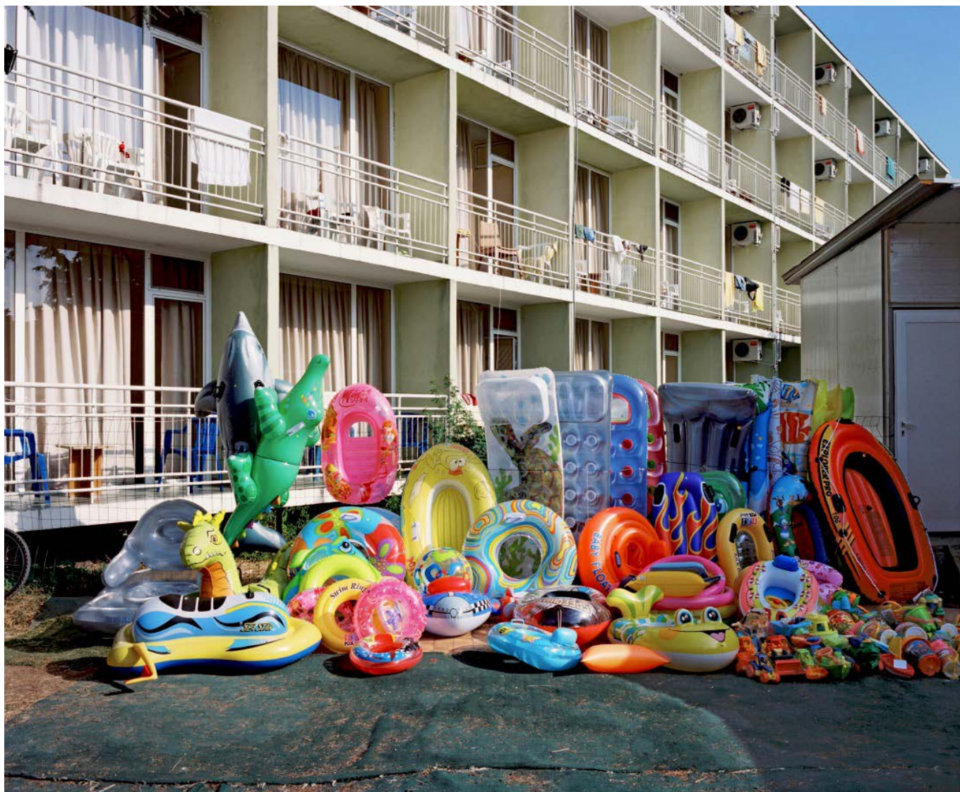
Un vendeur local vend des bateaux pneumatiques devant un hôtel dans la cité balnéaire de Sunny Beach, en Bulgarie.