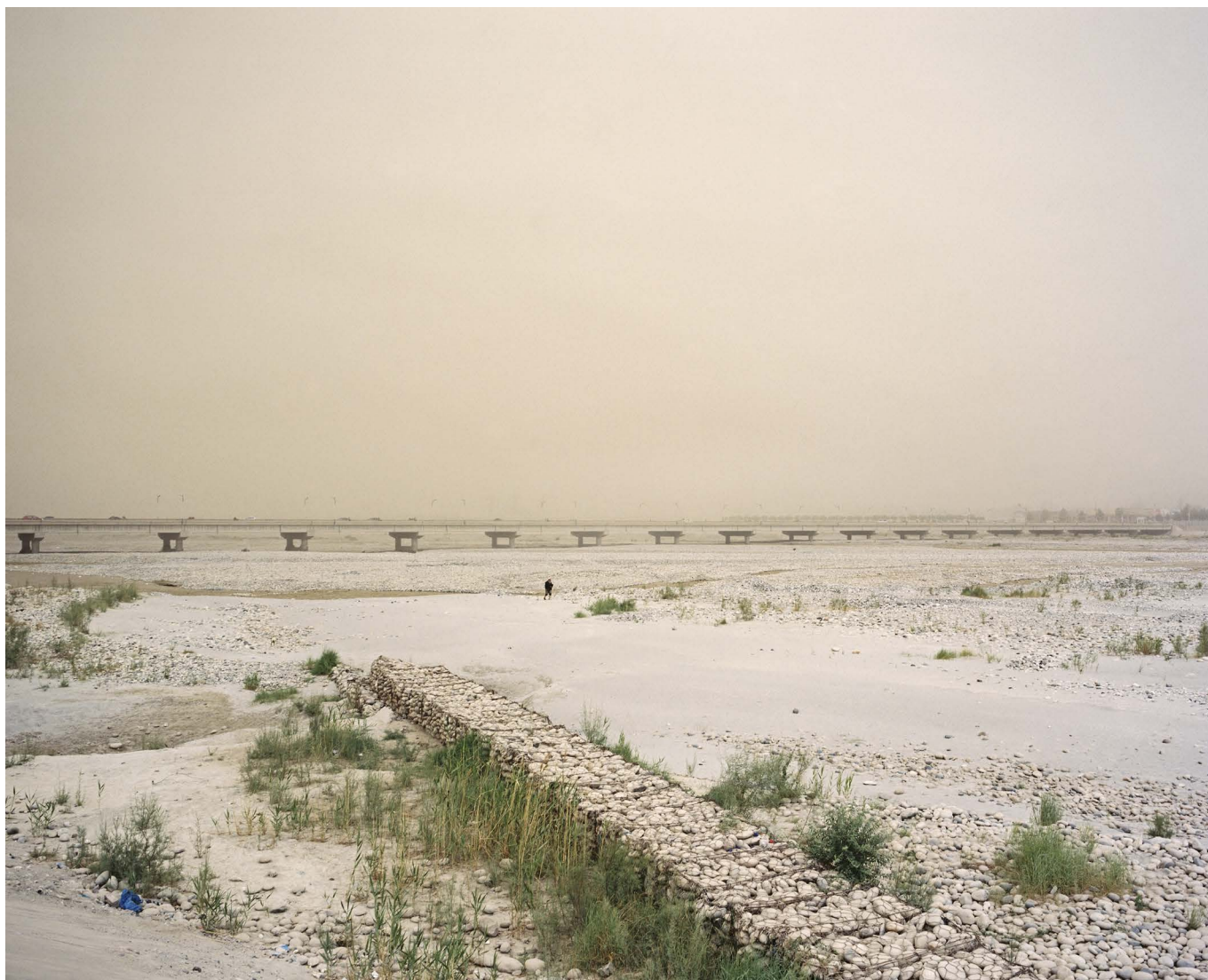
Un chercheur de jade marche dans la rivière du Yurungkash. La rivière prend source dans la montagne de Kunlun et termine dans le désert du Taklamakan. Hotan, Chine.